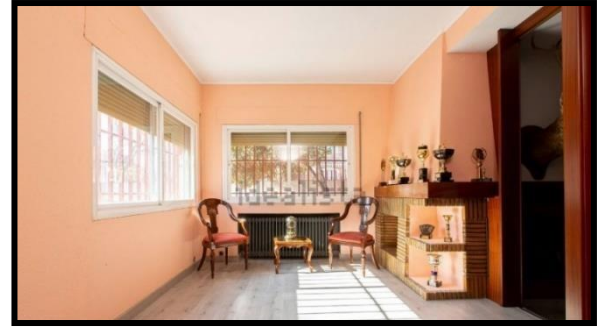
图二, 书房, 可用作客房